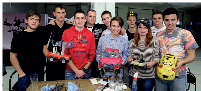
AUDI Kreativity csapatunk

A közismereti tantárgyak eredményességét illetően kiemelkedik a matematika, amely egyrészt a sokféle versenynek, másrészt a műszaki jellegű képzésünkhöz igazodóan a tantárgy fontosságának tulajdonítható. Ebből a tantárgyból az országos összesített rangsor alapján is (beleértve az elit gimnáziumokat is) az igen előkelő 2. helyen állunk. Szerencsére azonban a többi tantárgy is sorra országos szintű eredményeket tud felmutatni tanáraink kiváló tehetséggondozó munkájának köszönhetően.